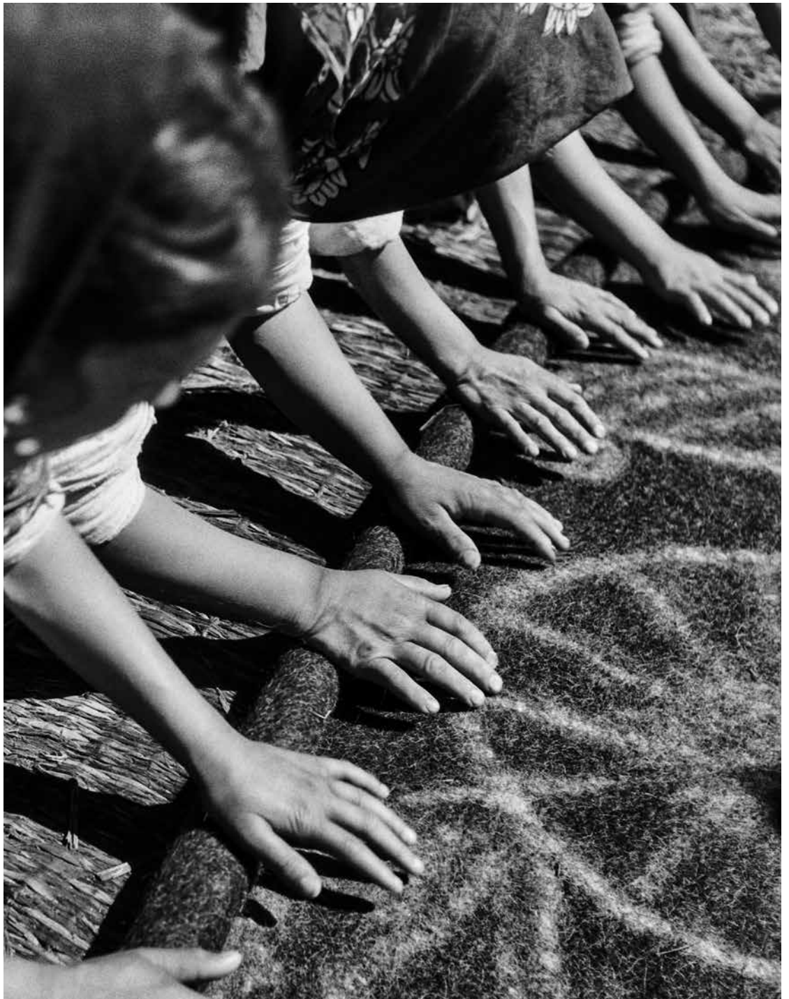
Hände, Antalya, Türkei, 1955